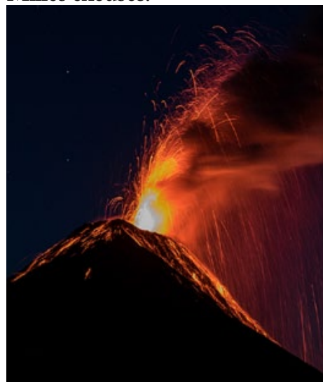
Couverture: Le Fuego depuis les flancs de l'Acatenango