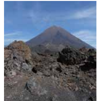
Couverture: Pico do Fogo

Infos régulières sur le site www.volcan.ch et sur notre page Facebook «Société de Volcanologie Genève»