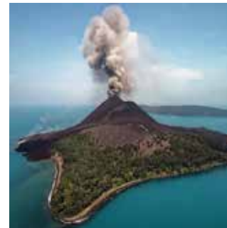
l'Anak Krakatau en septembre 2018

Infos régulières sur le site www.volcan.ch et sur notre page Facebook «Société de Volcanologie Genève»