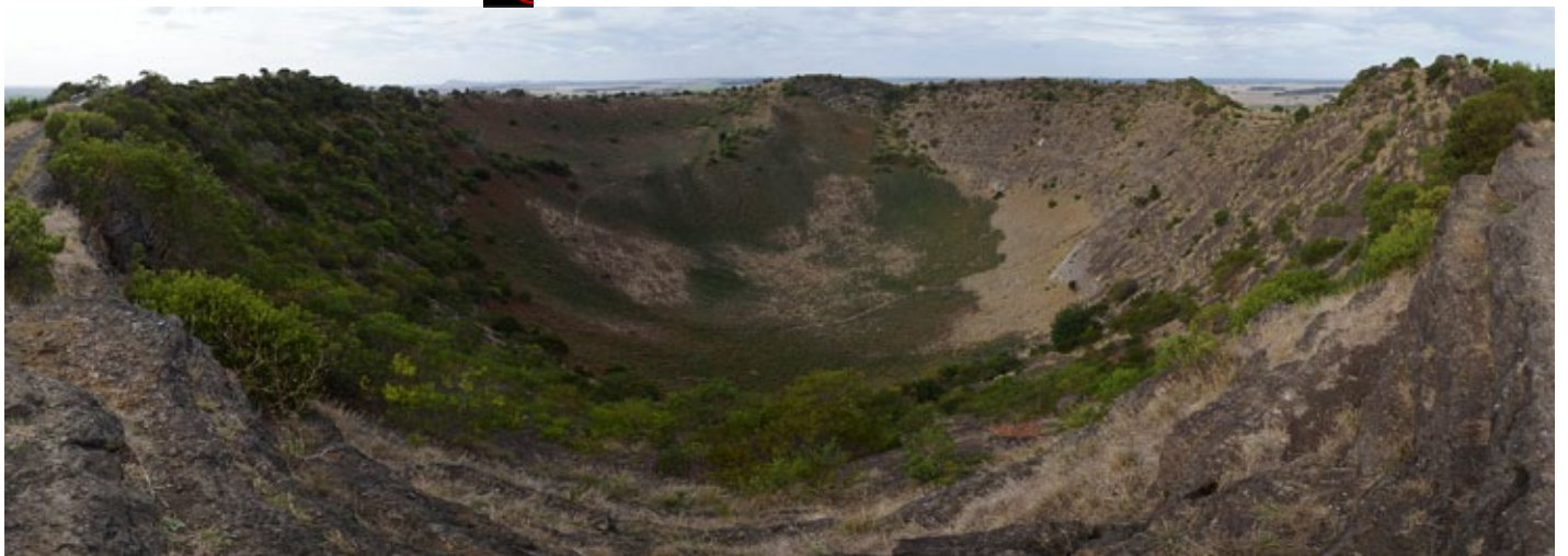
Le Mount Gambier, qui donne aussi son nom à la ville adossée à ses flancs, constitue le réservoir d'eau de la région.