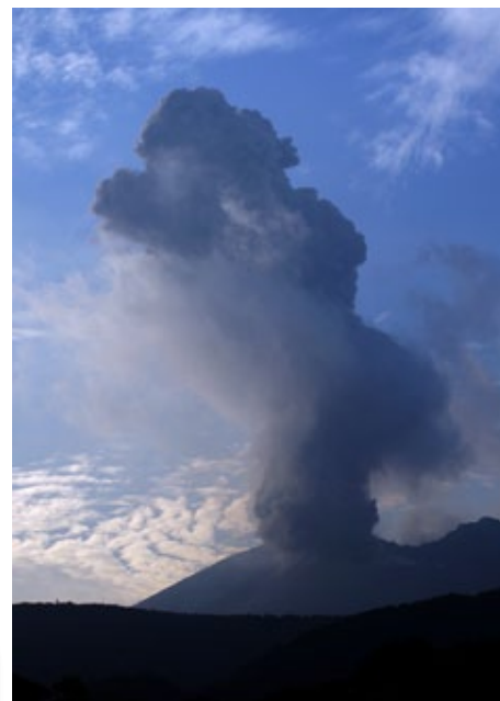
Couverture: Explosion au Sakurajima