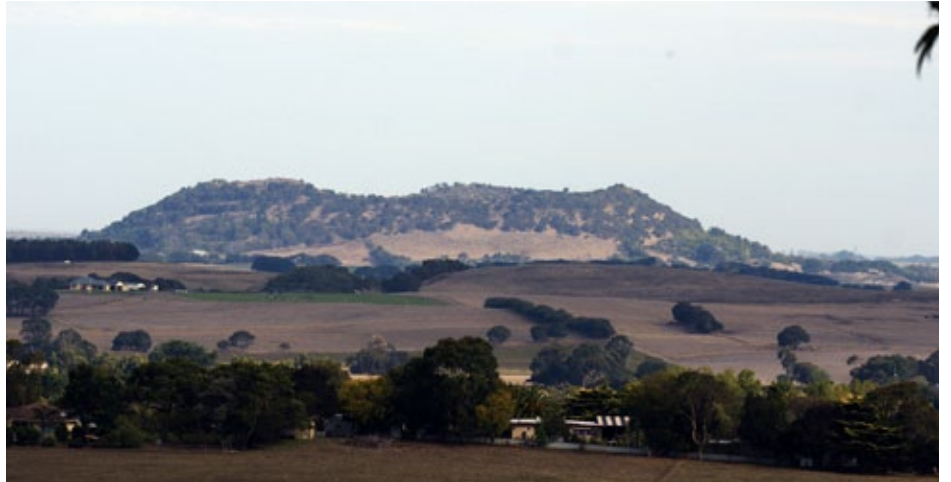
Mount Schank vu du Mount Gambier et vu du cratère

Lors de mon passage en Australie, au mois d'avril 2013, j'ai naturellement regardé s'il n'y avait pas un volcan à aller visiter ? Rien d'actif, car on n'entend jamais parler de ce continent dans les sites de volcanologie sur internet. Finalement, j'ai trouvé une quinzaine de noms de cratère. Ils sont tous situés dans le Sud. Les dernières activités datent de plus de 5000 ans avant notre ère. C'est donc effectivement pas très récent et tous sont considérés comme éteints. Voici les 2 que j'ai aperçus.