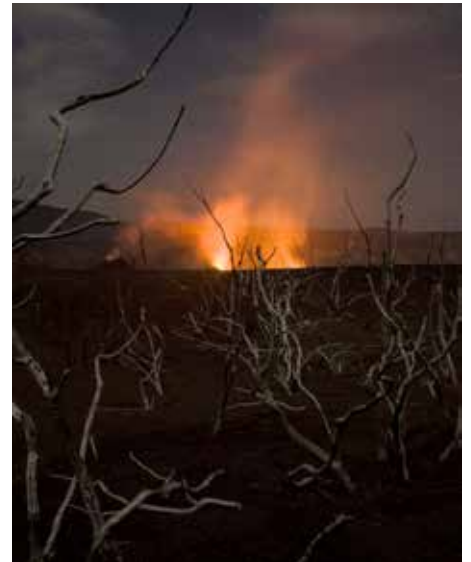
Couverture: Le Nyamuragira