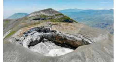
Couverture: Nouveau cratère de Ol Doiyo Lengai, Tanzanie

L'activité volcanique de Ol Doiyo Lengai par Patrick Marcel