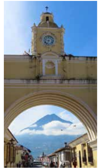
Couverture: Le volcan Agua, Guatemala. Photo © Dominique Bostyn, nov. 2022

Derniers délais pour l'envoi de votre article, photos et micro-reportages le 8 du mois précédant la parution du bulletin à bulletin@volcan.ch