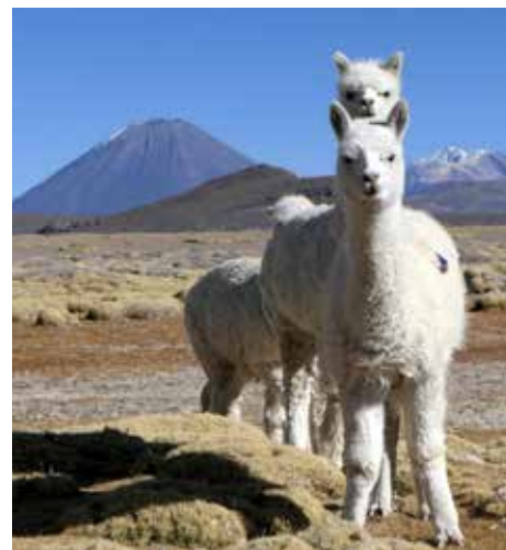
Volcan Misti

Derniers délais pour l'envoi de vos articles, photos et microreportages le 8 du mois précédant la parution du bulletin à bulletin@volcan.ch