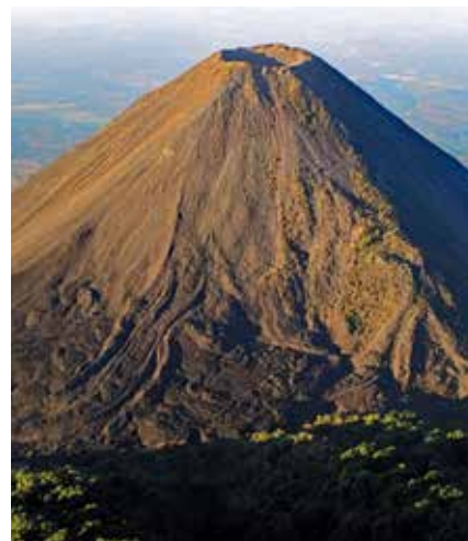
Couverture : Le magnifique cône de l'Izalco au Salvador

Derniers délais pour l'envoi de vos articles, photos et microreportages le 8 du mois précédant la parution du bulletin à bulletin@volcan.ch