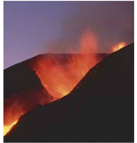
Volcan Fogo

Derniers délais pour l'envoi de vos articles, photos et microreportages le 8 du mois précédant la parution du bulletin à bulletin@volcan.ch